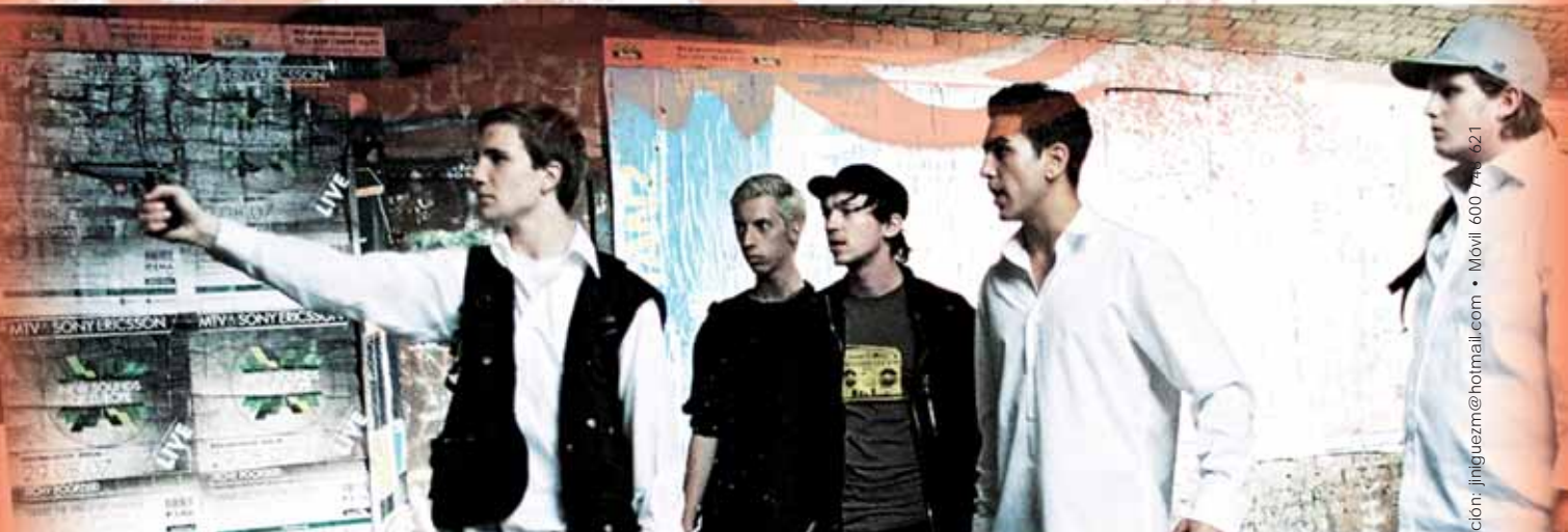
Guías elaboradas por Semana de Cine Espiritual.

SEDES: Alcalá de Henares, Alicante, Ávila, Barcelona, Bilbao, Burgos, Canarias, Coruña, Guadalajara, Lleida, Madrid, Mallorca, Málaga, Menorca, Ourense, Palencia, Santiago de Compostela, Sant Feliu de Llobregat, Sevilla, Tarragona, Terrassa, Toledo, Valencia, Valladolid, Vic, Vigo, Vitoria, Zamora y Zaragoza. Ferrara (Italia).